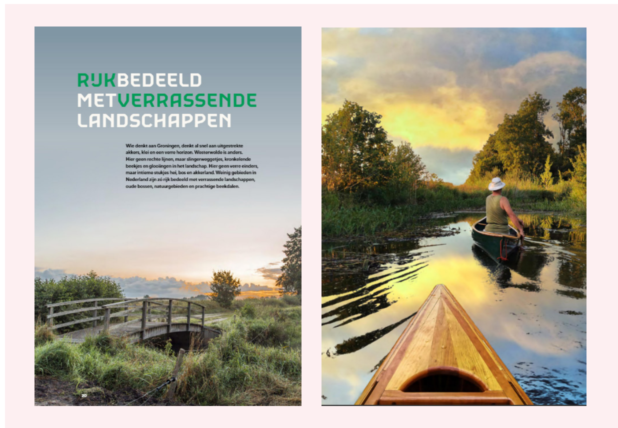
† Twee pagina's uit het Magazine "Bezoek Westerwolde".

“Door heel Nederland hebben wij moeite om onze onderhoudsteams en boswachtersteams in te vullen, behalve hier”.