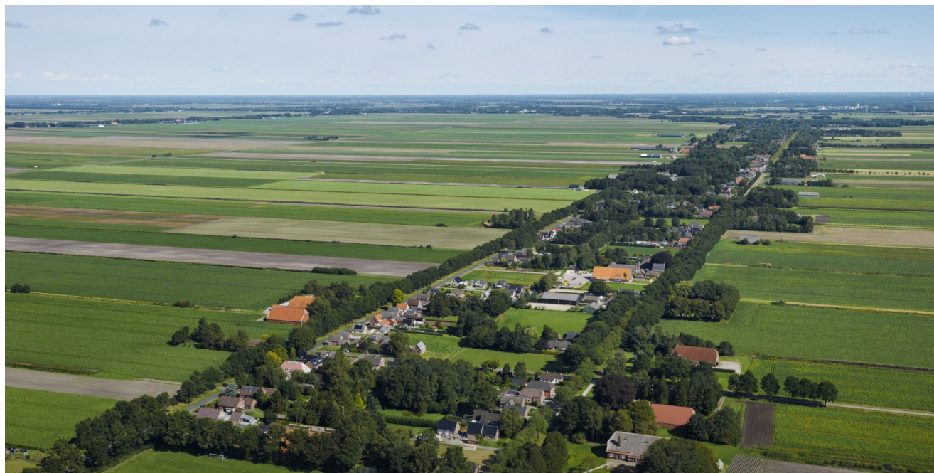
† Veenkoloniaal landschap.

Heel belangrijk is dat mensen heel graag echt mee willen denken en goed meegenomen worden in beslissingen. Omdat de Nedersaksenlijn een bottom-up initiatief is, ligt de voedingsbodem voor een goede samenwerking met de omgeving er al. De verbinding met omgeving moet echter in alle fasen van het MIRT goed opgezocht blijven worden.