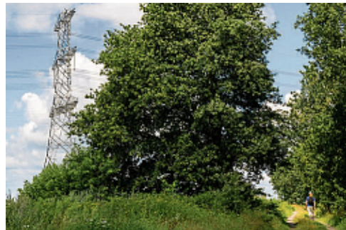
Het pad tussen de A.G. Wildervankweg en Zandberg.