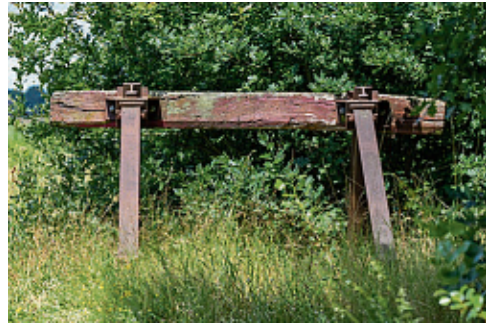
Bij dit stootblok eindigt de oude stoomtreinlijn.

“ Je hebt hier eigenlijk alles. Behalve een uitgaansleven