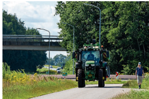
De A.G. Wildervankweg in Ter Apel.