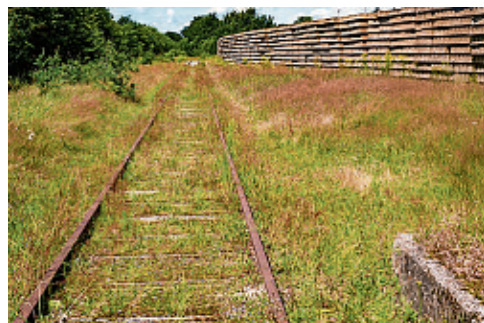
Stapels met dwarsliggers langs het dubbelspoor bij station Musselkanaal.