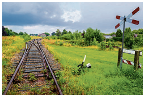
Het spoor tussen Musselkanaal en Stadskanaal.

went eraan.” Dat sommige andere bewoners minder enthousiast zijn over een trein door de bebouwing, is volgens hen „angst voor het onbekende”. „Uiteindelijk zou het natuurlijk fantastisch zijn voor dit gebied. Liever vandaag dan morgen, het had eigenlijk al jaren geleden moeten.”